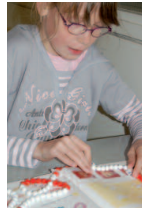
Kinderen met een autistische stoornis zijn erg visueel ingesteld.

Kracht De school is blij met de Reken-Wijzer. Miriam: 'De kracht van de methode is dat het zo praktisch is en dat het vanuit de stoornis is opgebouwd. Dit maakt het heel herkenbaar en toepasbaar. Die herkenning komt nog eens extra terug in de praktijkvoorbeelden die in de methode staan opgenomen. Ook aan deze voorbeelden zijn weer tips gekoppeld, die je zo kunt toepassen in de praktijk.'