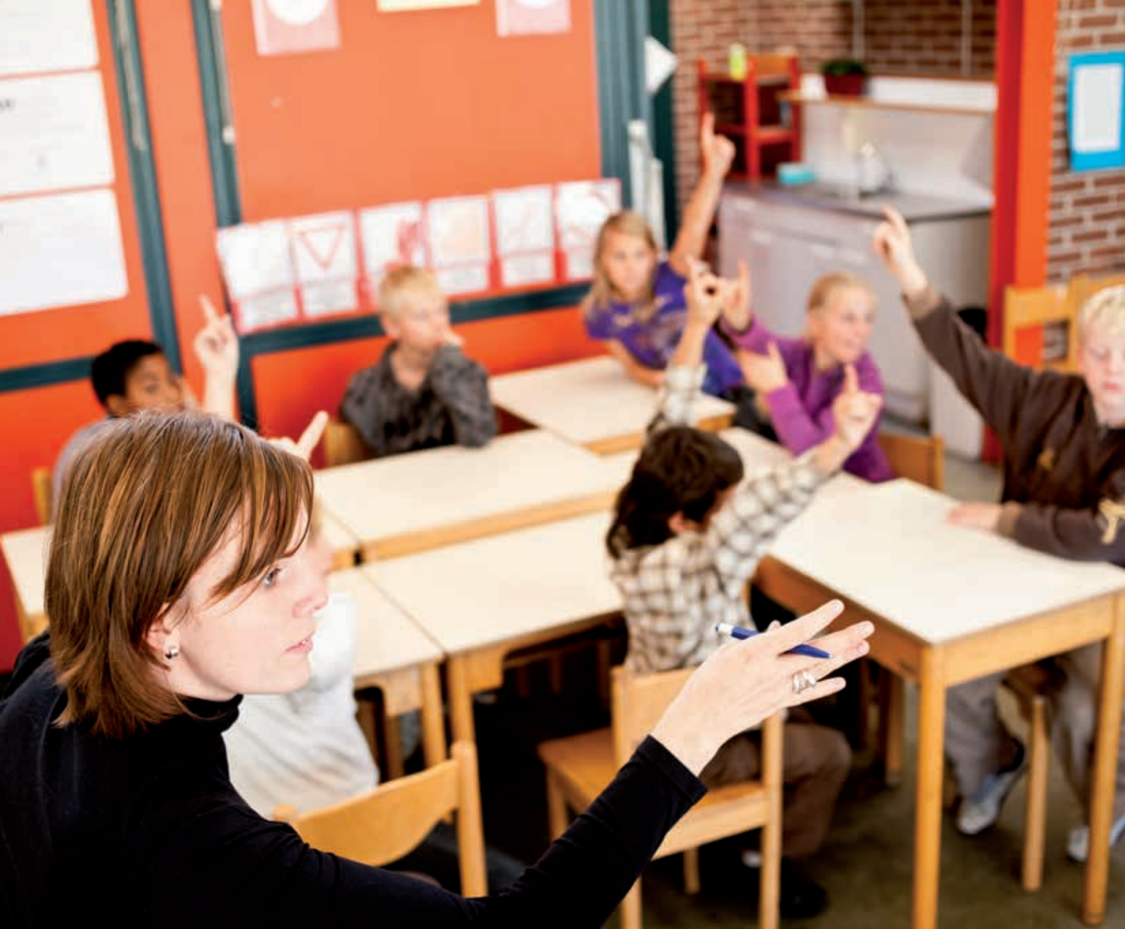
Human Touch Photo