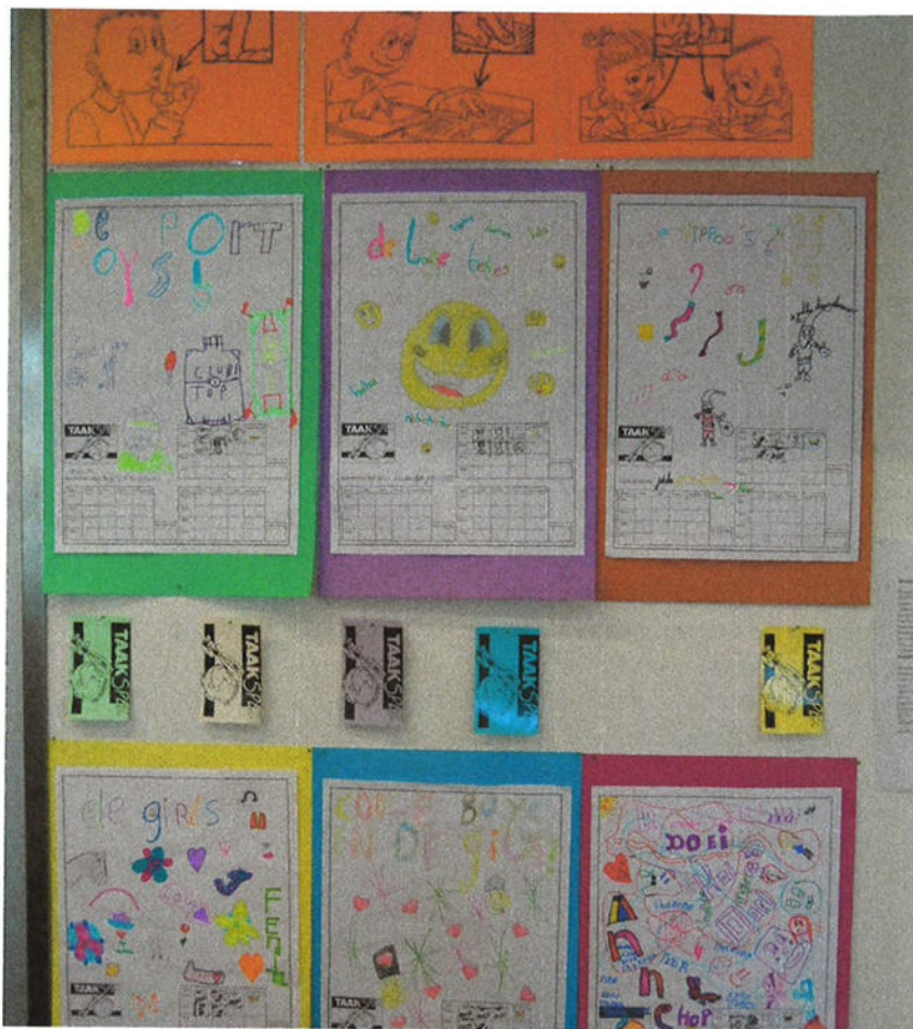
Tekeningen van kinderen die met Taakspel werken.

school. Ten eerste bleek de mate waarin het programma geborgd was, twee jaar na aanvang, enorm te verschillen tussen de scholen. Op sommige scholen liep het nog als een trein, op andere ging het wat moeizamer en enkele scholen waren er zelfs mee gestopt. Vervolgens zijn we dieper ingezoomd op hoe deze verschillen te verklaren zijn. Daarbij is gebruikgemaakt van het eerder beschreven model.