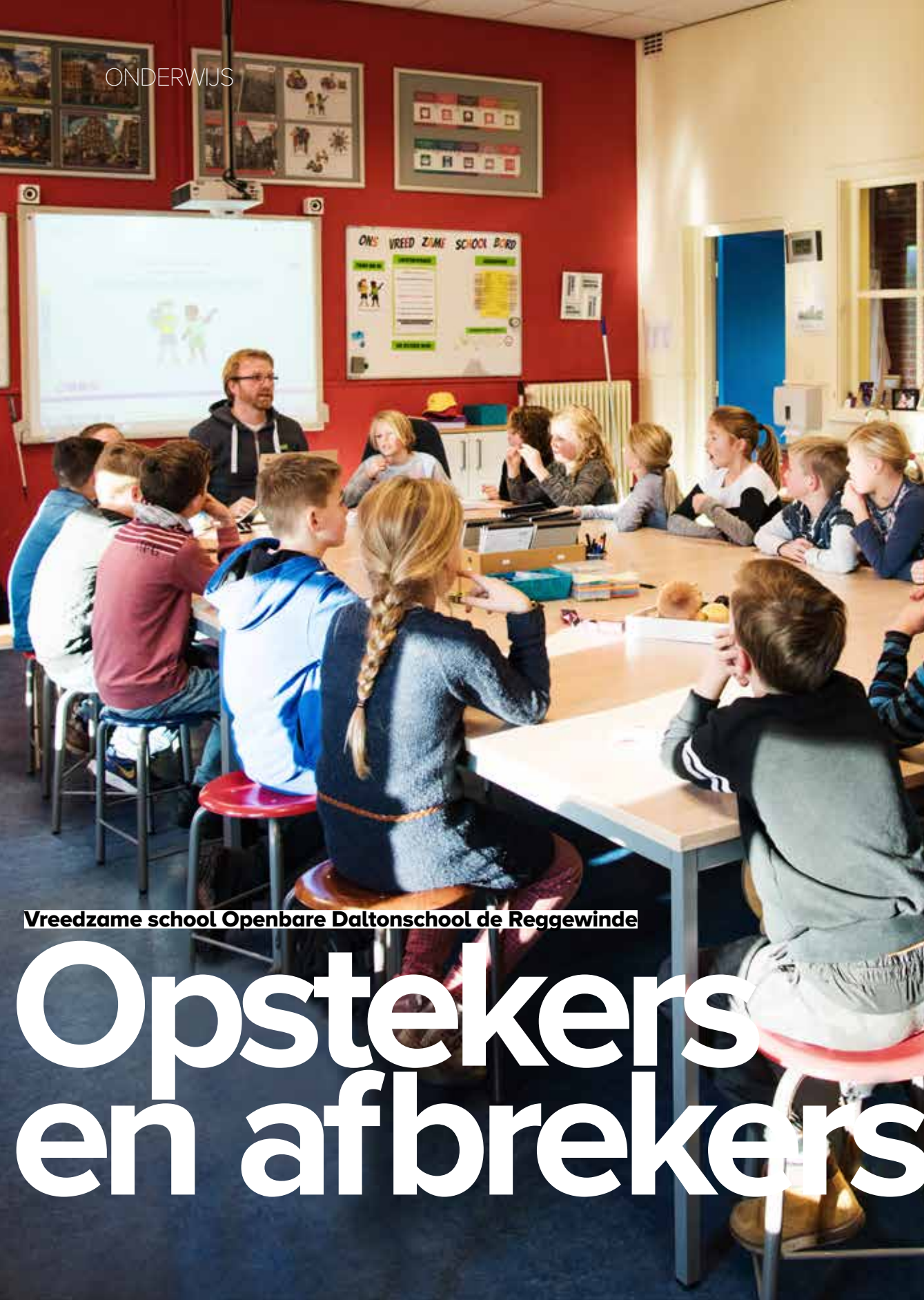
Vreedzame school Openbare Daltonschool de Reggewinde